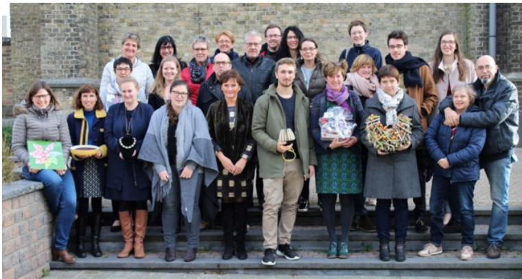
Op de persvoorstelling werden de deelnemers aan de tweede editie van Jolie Boutique voorgesteld.

24/11/2017 om 14:36 door Eric Vanhooren - Print - Corrigeer (mailto:redactienbo@nieuwsblad.be?subject=Correctie%20-%20Tweede%20editie%20creatievelingenbeurs%20Jolie%20Boutique%20staat%20op%20stapel&body=https://www.nieuwsblad.be/cnt/bleva_03205299)