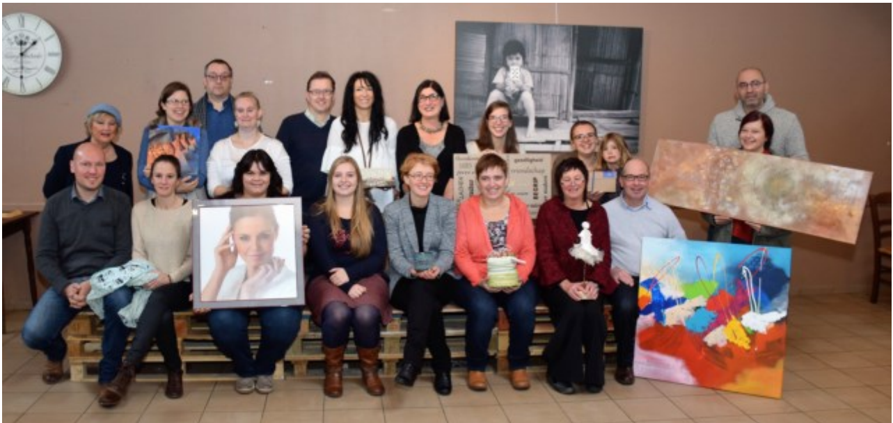
De deelnemers aan de gloednieuwe beurs 'Jolie Boutique', welke dit weekend plaatsvindt in zaal Den Akker.

26/11/2016 om 04:05 door Eric Vanhooren - Print - Corrigeer (mailto:redactienbo@nieuwsblad.be?subject=Correctie%20-%20%E2%80%98Jolie%20Boutique%E2%80%99%2C%20een%20creatievelingenbeurs%20die%20je%20onbekend%20talent%20)